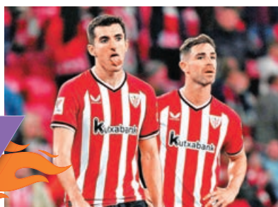
畢爾包眾將季尾出現疲態。

基達菲今季主場僅輸3仗，而且自2016年以來，主場6次迎戰畢爾包1勝5和不敗，主場一向硬淨值得支持。