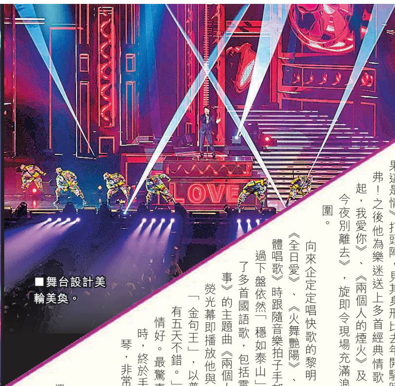
舞台設計美輪美奐。