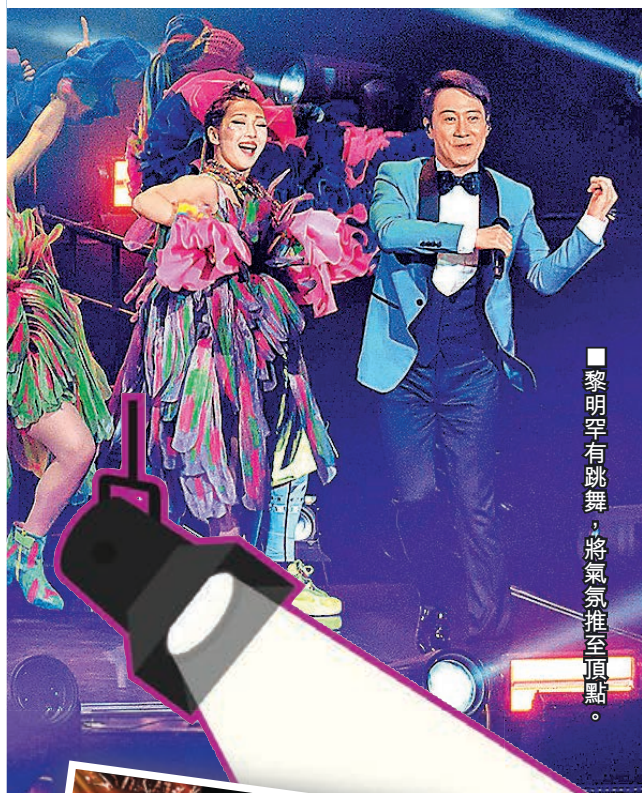
黎明罕有跳舞，將氣氛推至頂點。