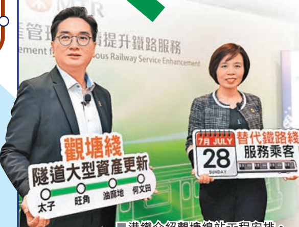
港鐵介紹觀塘線站工程安排。