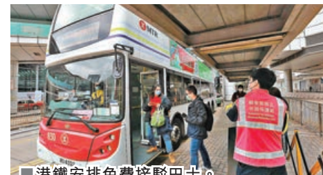
港鐵安排免費接駁巴士。