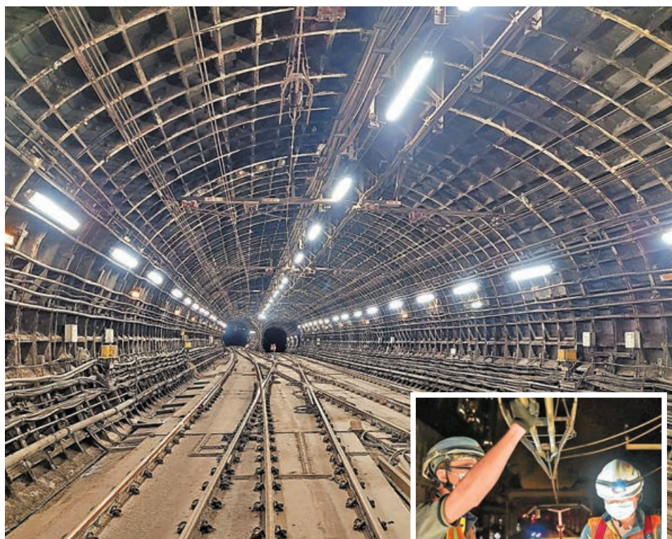
港鐵計劃在觀塘線油麻地站隧道更新基建設施。

李劍雄指，「港鐵列車全天運行19小時，扣除檢測和準備時間，工程人員只剩下收車後『黃金兩小時』進行相關資產更新、維修及新鐵路工程。」但這次大型更新工程複雜，吊架位於隧道頂部，更換時需要隔離電力系統，遷移和重置電纜及架空天線，更換後亦需要進行一系列測試，需時較長，風險較高，不能分階段進行或「早收遲開車」。他稱整個工程預計需時28小時，期間亦會把握時間更新1.3公里隧道內其他相關的設施，有信心在預定時