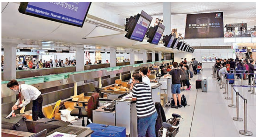
■新安排下，香港快運部分票價不包括寄艙行李。

不少精打細算的市民，每逢出遊都會選擇乘搭價格相對便宜的廉航客機，國泰航空集團旗下廉航香港快運昨日就宣布，即日起推出全新票種選項，由以往兩種票價選項增至四種，當中最便宜的「輕便飛」，乘客只可攜帶一件隨身物品上機，重量上限7公斤，並須放在前面座位下方，不可帶手提及寄艙行李。以飛一轉日本大阪為例，選乘最新的「輕便飛」只需1,238元，較以往約1,600元優惠機票便宜近400元。