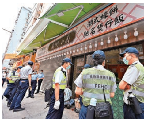
■「廟街小廚」及另一食肆被食環署封舖。

食環署發言人昨表示，該署一直就該兩間食物業處所的嚴重違規情況採取執法行動，並調配人手加強執法力度，惟兩間食肆仍持續無牌經營及阻塞公眾地方，屢次違反《食物業規例》及其他相關法例，食環署因此已在上月30日獲