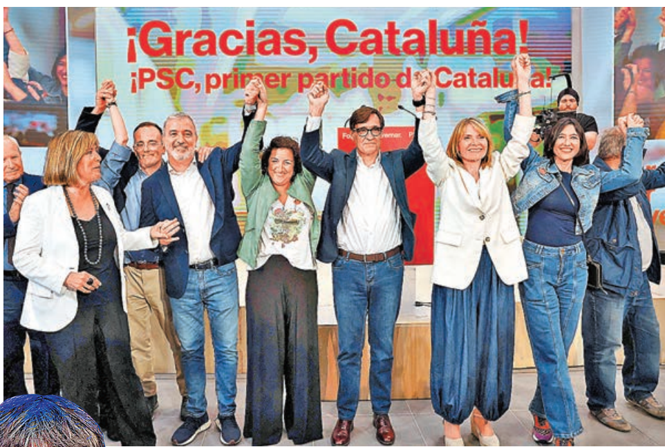
■統派的社會黨領袖伊拉（右四），勝選後與黨友慶祝。