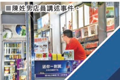
陳姓男店員講述事件。