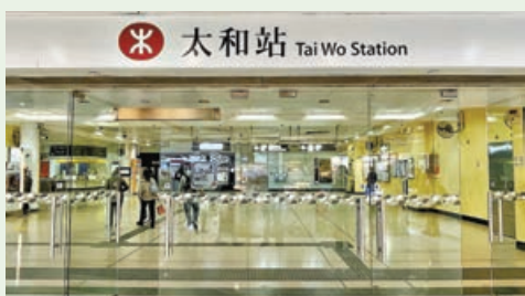
■屋苑步行到太和站僅需14分鐘。