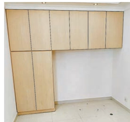
■房間訂製的入牆收納櫃。