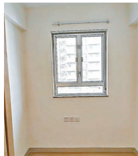
■舊樓房間多沒有窗台。