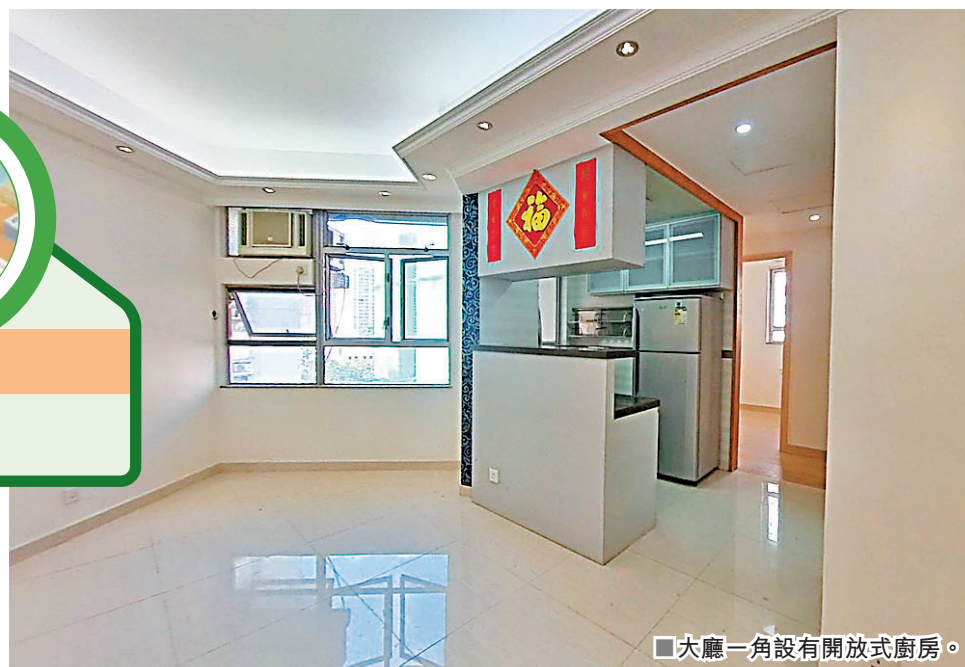
■大廳一角設有開放式廚房。