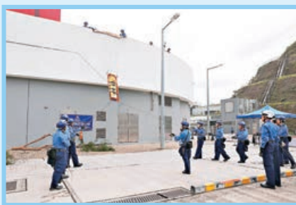
■隊員用高點拯救法搜救。

年極端天氣加劇，民安隊要做好充分準備，並已就處理極端天氣和應對風暴行動進行檢討，增加搶救隊伍數目及提升裝備，去年至今已舉辦8個與水災救援相關的訓練課程，培訓逾110名救援人員，今年稍後再舉辦6個水災救援課程，預計培訓多逾百人。民安隊另開設多個山嶺搜救相關課程，已有逾700人參與學習。