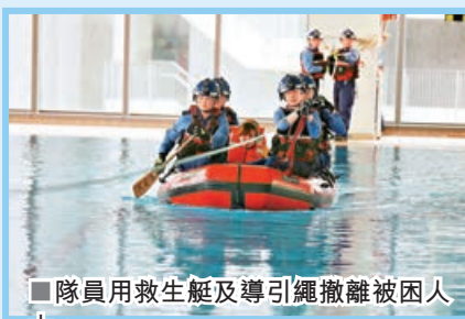
■隊員用救生艇及導引繩撤離被困人士。