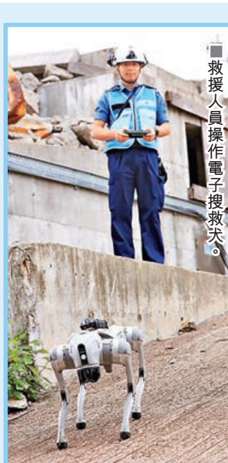
■救援人員操作電子搜救犬。