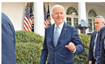
■拜登不滿國際刑事法院申請向以色列總理發拘捕令。

在一份希伯來語公開聲明中，內塔尼亞胡質問國際刑事法院「多麼膽大」，竟敢將哈馬斯和以色列相提並論。他稱，這種比較是「對現實的歪曲」，並指責國際刑事法院檢察官「給全世界肆虐的『反猶太主義』火上澆油」。以外長甘茨稱「這是一個將永遠被銘記的歷史恥辱」，他指以將成立一