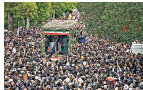
■在伊朗大不里士，大批民眾送別載有萊希等人的靈車。

萊希的首場遺體告別儀式周二在東阿塞拜疆省首府大不里士舉行，數萬名民眾在市中心一個廣場聚集，跟隨載着萊希及其他遇難隨行人員靈柩的車輛，沿途部分人情緒激動。