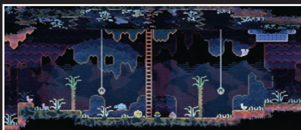
《ANIMAL WELL》 霓虹色的井底世界。

缺點是，這款遊戲同樣不支持繁體中文。不過遊戲內幾乎沒有文字與劇情，道具的指引也十分便於理解，所以不用擔心這會影響到解謎。類銀河戰士惡魔城遊戲愛好者與解謎控千萬不要錯過。