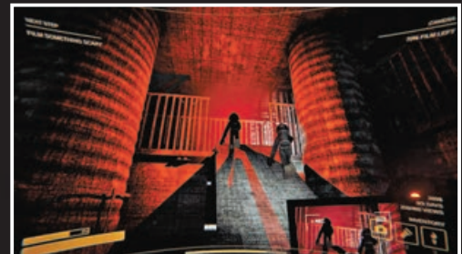
《Content Warning》在地下拍攝驚悚相片。