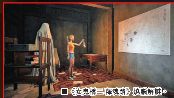
《女鬼橋三 釋魂路》燒腦解謎。

而作為玩家的你，將分別操作四位角色，在盛大舉行「恐怖嘉年華」活動的文華大學裏，以不同視角親自體驗「鬼樓」的恐怖之處，小心那些黑暗裏的角落，千萬不要被追上哦！