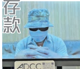
馬先生透過視像講述受騙經過。