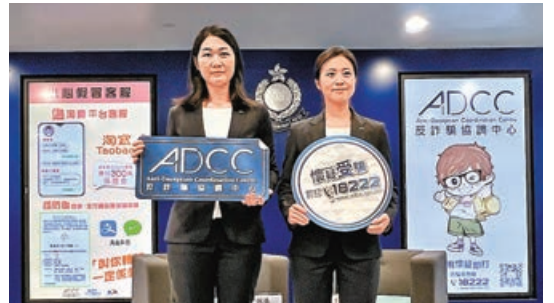
警方提醒市民多加防範新冒起的「假冒客服」手法。

嚇若不繳費就會凍結其所有香港銀行戶口。事主兩日間透過網上銀行手機應用程式，從戶口多次轉賬共291萬元，及利用信用卡透支轉賬125萬元，共被騙去416萬元。