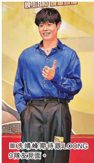
■冼靖峰期待跟LOONG 9隊友見面。