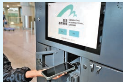
休息區裏增設手機充電站。