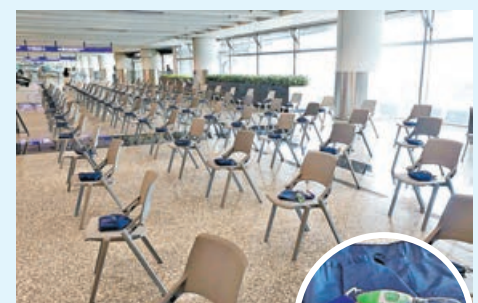
機場客運大樓休息區提供至少500張座椅，物資包裏有水、餅乾及毛氈。

天文台表示，按現時預測路線，該熱帶低氣壓會在昨晚至今早與香港維持超過250公里距離，與其相關強風昨日仍未普遍影響本港。天文台預料今日吹東至東南風4至5級，稍後離岸及高地間中6級；多雲，間中有狂風驟雨及幾陣雷暴，稍後雨勢有時頗大，海有湧浪。因海面有湧浪，天文台呼籲市民遠離岸邊及停止所有水上活動，並留意最新天氣消息。