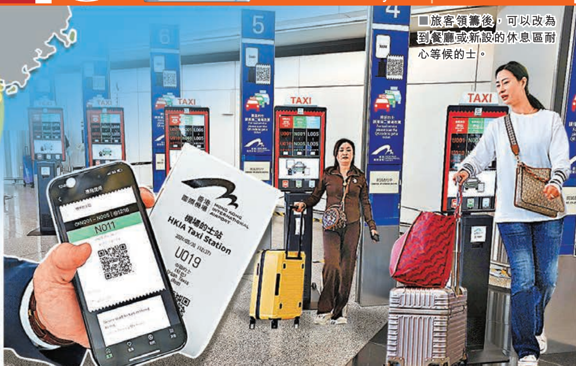
旅客領籌後，可以改為到餐廳或新設的休息區耐心等待的士。