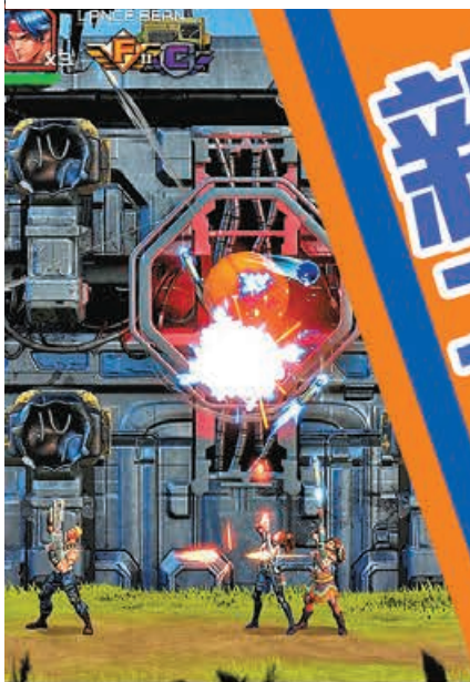
■紅白機玩家可以在遊戲中重溫童年回憶。