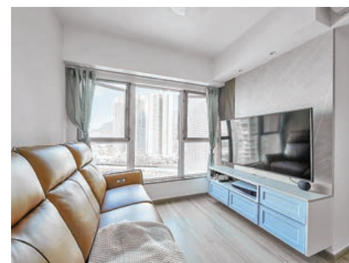
■ 客廳傢具及牆身的配搭洋溢北歐小清新風格。