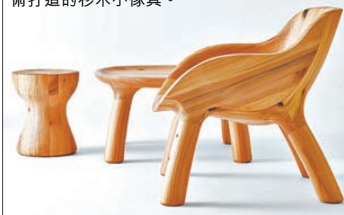
■ 日雕塑家用 3D 切割技術打造的杉木小傢具。

日本著名雕塑家三澤敦彥 (Atsuhiko Misawa) 採用非傳統傢具製作的方法，以日本的小直徑杉木作為傢具原材料，使用 3D 切割技術雕刻而成一件件樹紋木小傢具。事實上，三澤敦彥的設計為這些小木椅、小木枱注入了生命，賦予它們生命力。