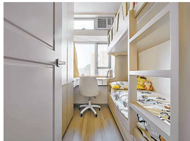
■ 睡房色調用上淺色系，讓房間視覺擴大。