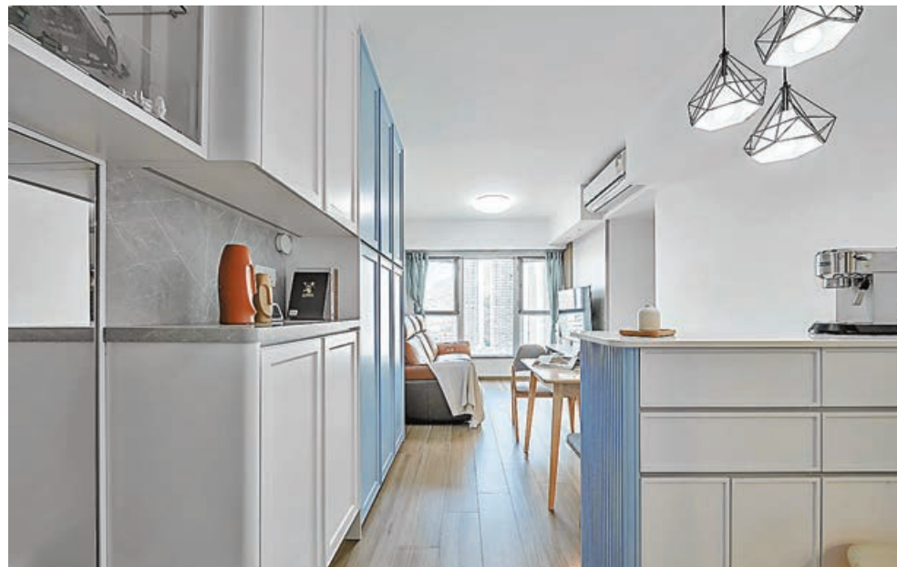
■ 廚房改為開放式，並加設中島位置。