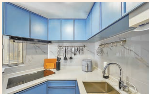
■ 廚房收納櫃和廚枱藍與白色彩配搭十分柔和。