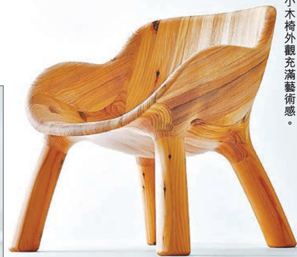
■ 小木椅外觀充滿藝術感。