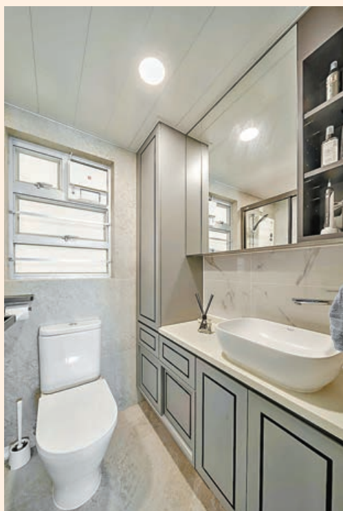
■ 灰色廁櫃配合白色雲石櫃面。