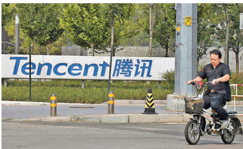
騰訊否認被要求降低微信支付市佔率。

另一方面，市場情緒回復理性後，總體謹慎觀察氛圍再次形成，有別於4月中展開的一波普漲，估計投資者在選股上，以優質股為先。