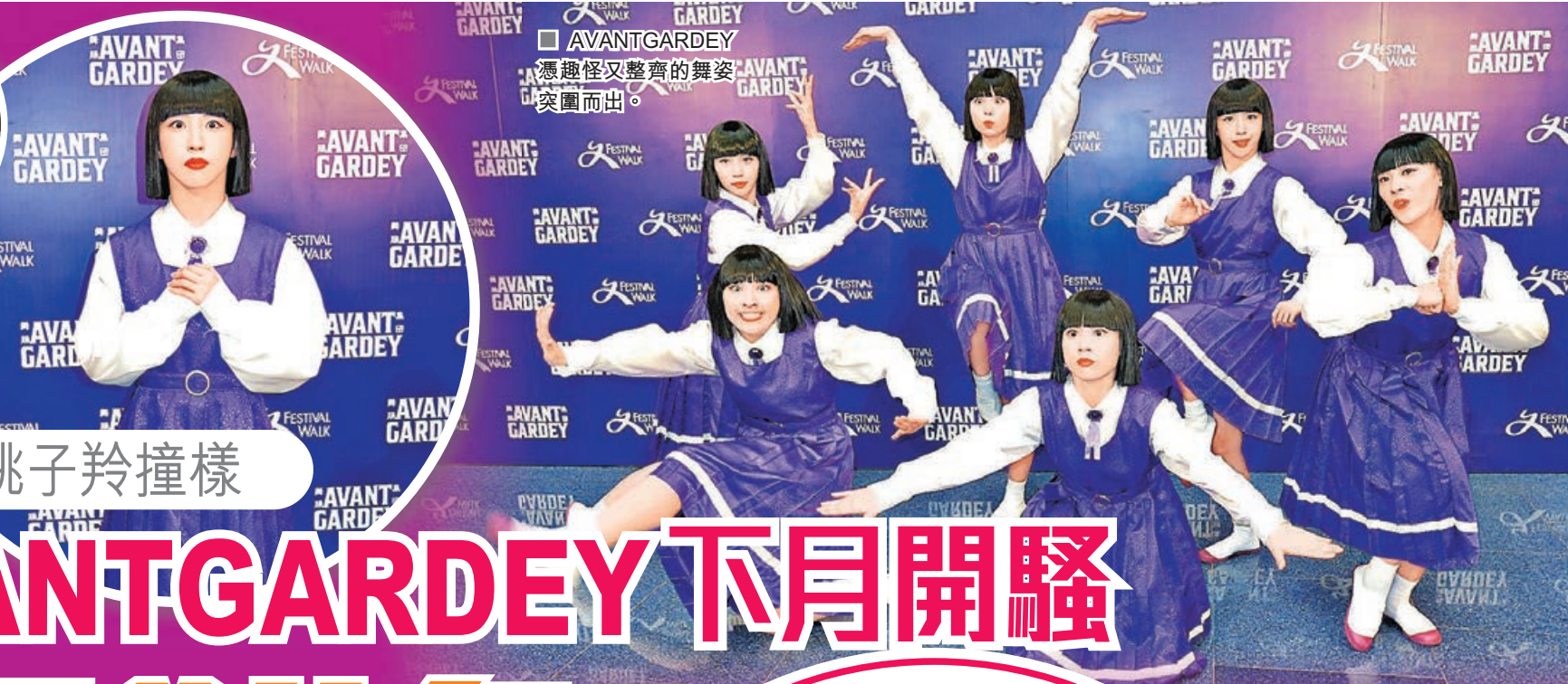
AVANTGARDEY 憑趣怪又整齊的舞姿突圍而出。