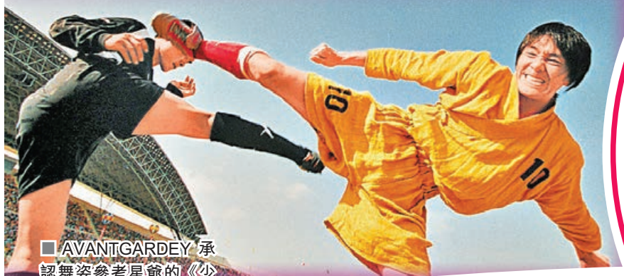
■ AVANTGARDEY 承認舞姿參考星爺的《少林足球》。