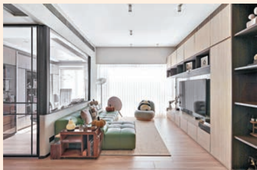
■客廳梳化背後的透明設計書房，陽光射入倍覺心曠神怡。