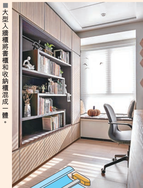
■大型入牆櫃將書櫃和收納櫃混成一體。