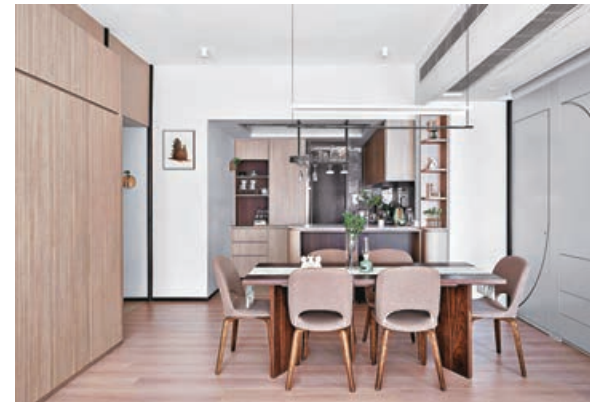
■半開放式廚房與飯桌融為一體。