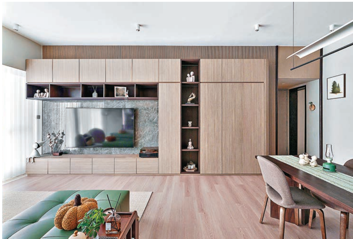
■客廳電視牆身使用雲石紋理和木色條紋作為配搭。