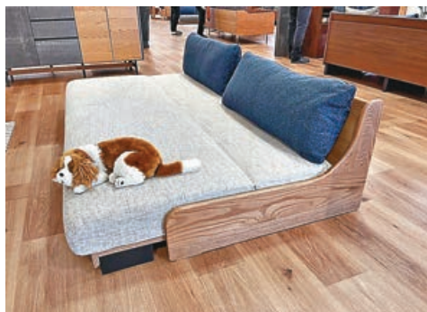
■寵物喜愛懶洋洋地躺在梳化床上休息。

是次介紹從日本引進的梳化床，開合方法簡單，而且實用好坐。其中Meuble這個品牌的梳化床，不單好坐，而且外形美觀又耐用。最特別之處是梳化床的布料可以拆下來清洗，所以家中寵物也愛躺在梳化床上休息，又或者依偎着你玩耍。