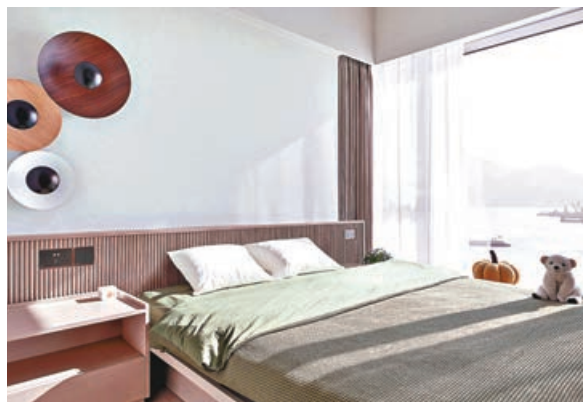
■主人房特設的裝飾牆，充滿前衛藝術感。

另外，當坐在書房工作時，透過室內的窗看到室外的日夜變化，讓工作與家居連結，共享生活美好風景。