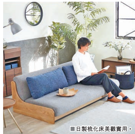
■日製梳化床美觀實用。