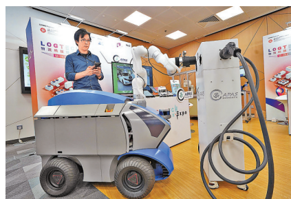
■昨日展出的全自動電動車充電機械人。