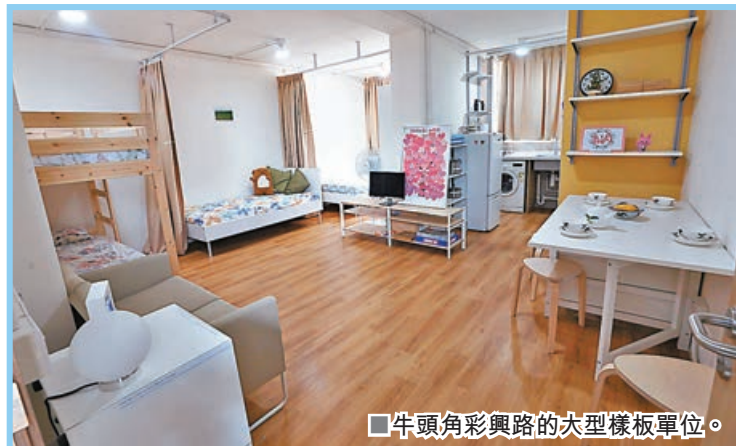
■牛頭角彩興路的大型樣板單位。