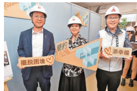
■何永賢（中）昨日公布首批簡約公屋申請詳情。