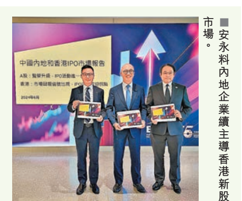
■安永內地企業續主導香港新股市場。

歐盟對內地電動車加徵關稅，由於市場已消化有關預期，比亞迪股份(1211)彈5.8%，是表現最佳藍籌，吉利(0175)也漲1.7%。