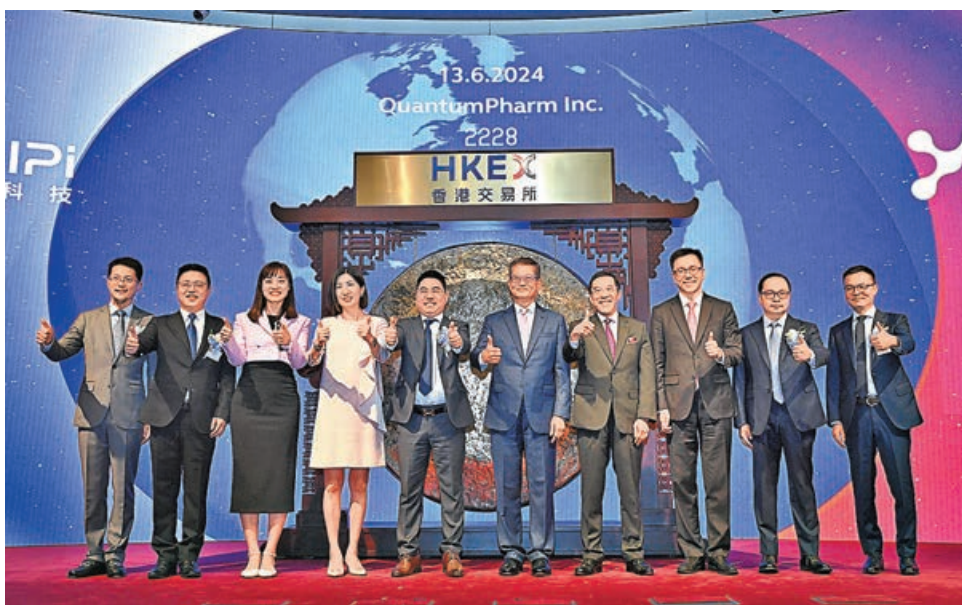
■首隻特專科技股—晶泰科技上市是港股發展重要里程碑。

創新及科技局局長孫東指出，晶泰是半年來第2家引進香港重點企業在港成功上市，未來希望能見證更多香港創科企業上市。香港未來創新發展其中一個重要方向就是鼓勵創投融資，下一步特區政府會進一步加大「政產學研投」高效合作，幫助更多企業在港做大做強。