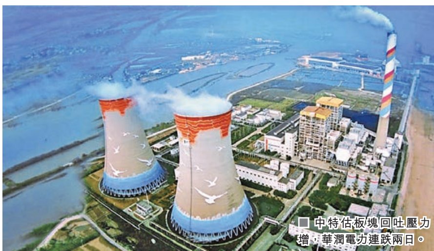
中特估板塊回吐壓力增，華潤電力連跌兩日。

另外，日本股市亦急挫，日經指數跌712點或1.8%，日本央行上周公布維持利率不變，但要到7月才宣布縮減購債規模，增加不明朗因素，加劇市場避險意識。