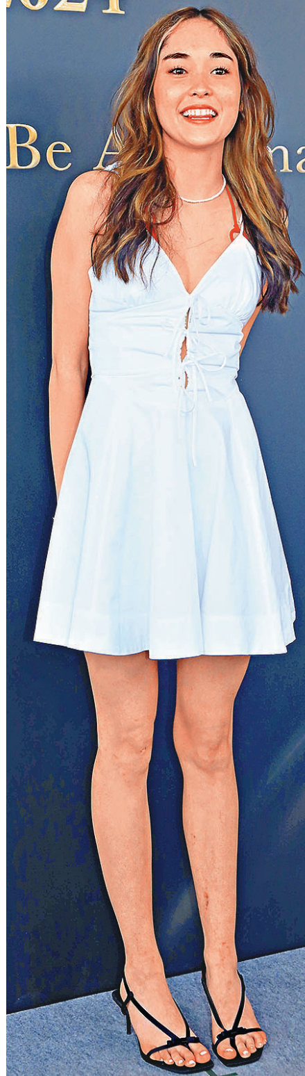
■Aisha青春無敵是最大本錢。