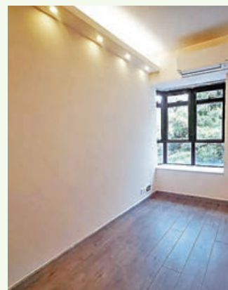
■主人房裝了特色燈槽。