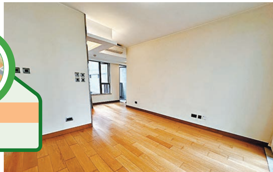
■客廳在大廳轉角處，地方更見使。