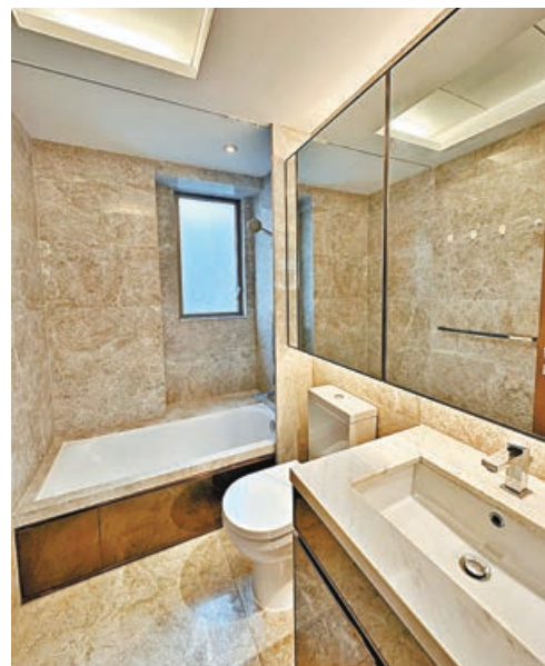
■浴室採用酒店式標準，並且是明廁。