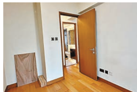
■睡房近門口牆角可擺放書櫃或衣櫃。