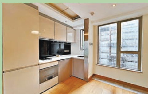
■開放式廚房貼近大窗戶，空氣流通光線足。