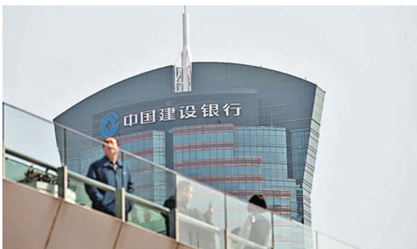
北水買建設銀行沽充礦能源。

港股繼續回調，恒指上周五(21日)再跌逾300點，惟仍能守在18,000點水平收盤，大市成交金額回升至近1,300億元，主要是富時指數調整成份股所致，若扣除這項因素，相信應低於年內日均成交金額1,108億元。