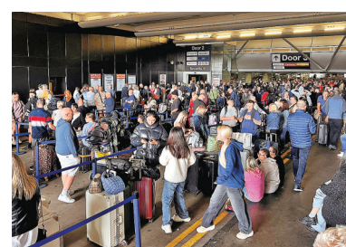
■大批等候辦理登機手續的旅客在櫃位等待，情況混亂。

英國曼徹斯特機場周日（6月23日）凌晨突發嚴重停電，一號及二號客運大樓停運長達兩個小時，多個航班延誤或取消，原定抵達曼徹斯特的多個航班也被迫改道，許多乘客被困在機場內排起長龍。機場周日早上聲明稱，正努力安排已抵達機場的乘客盡快登機，但行李系統運作依然受阻。