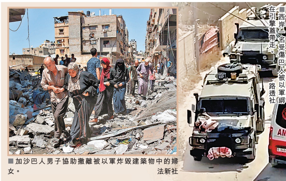
■加沙巴人男子協助撤離被以軍炸毀建築物中的婦女。

另據巴勒斯坦瓦法通訊社報導，以軍在約旦河西岸進行突襲期間，闖入民居並拘捕疑犯，在突襲期間，以軍拘捕來自希