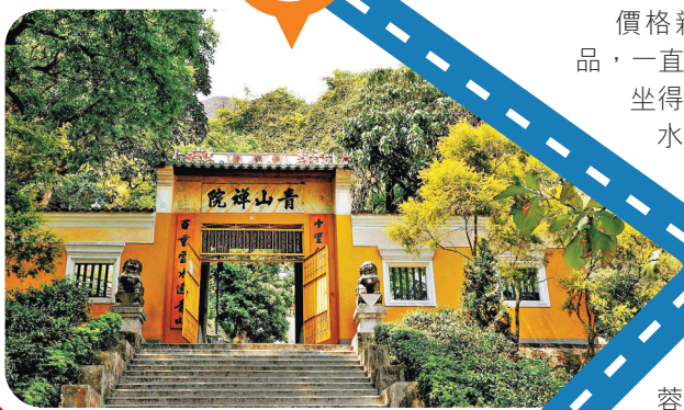
■青山禪院山門古樸。

於青雲輕鐵站下車，沿着山間瀝青路追尋杯渡禪師的傳說。或許香港的年輕人已經遺忘這座1,500年前的古刹——青山禪院，它曾是李小龍電影《龍爭虎鬥》的拍攝地，黃色山門彰顯著歷史的滄桑。山門對聯「十里松杉藏古寺，百重雲水繞青山」道盡它的風光，尋訪寺廟的途中兩道林木鬱鬱蒼蒼，仰頭望山頂被雲霧環繞，登至主殿更能將屯門市中心風景一覽無遺。