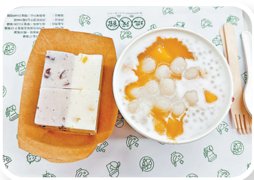
■地茂館甜品因平價一直備受街坊青睞。

價格親民又坐落在市中心屯門時代廣場的地茂館甜品，一直深受周邊街坊青睞，即使剛過午時，店內顧客已坐得滿滿。這家老字號糖水舖保留了大量懷舊中式糖水做法，以生磨炮製的杏仁茶、芝麻糊和手包爆餡湯圓贏得滿堂食客歡心。如果想點一份夏日消暑，那必須推薦港人最愛的芒果甜品，碗碗落足冰涼鮮甜的芒果粒及芒果蓉，為夏日增添透心涼。