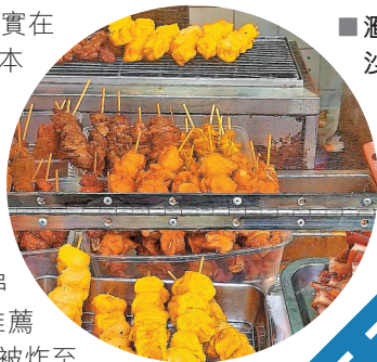
■滙景美食必食沙嗲汁炸燒賣。

屯門的美食地圖實在太過分散，只有屯門本地人才能找到屬於他們的地道深宵食堂。這間坐落於景峰的平價串燒店，最平只需8元就能享受一串惹味沙嗲串燒。其中，本地人推薦必試招牌燒賣，外皮被炸至脆卜卜，再淋上濃郁的秘製沙嗲醬汁，入口滿是幸福滋味，哪還管得上會否長胖！