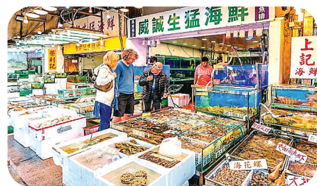
■三聖墟海鮮市場售賣的海鮮品種多樣。

當天新鮮捕捉到的魚蝦貝類，晚上就成了新鮮滾熱辣的桌上佳餚。因附近三聖廟得名的小漁村，如今成了港人最愛的新鮮海鮮市場。目前市場內聚集了約十多間海鮮檔，除了常見的海鮮，還有金邊方利、海紅斑等罕見本土海鮮提供。饕客可親自挑選最新鮮的貨品，帶至附近的酒家或大牌檔烹飪加工，也可直接選擇當地著名的酒家品嚐時令海鮮。