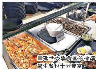
延世大學食堂的標準學生餐也十分豐富。