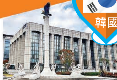
延世大學最具代表性的雄鷹雕像。

延世大學人氣超高的食堂，約3,800至6,000韓圓（約22至34港元）一份餐，十分便宜。附餐自己裝盛，泡菜、黃蘿蔔、黑豆、大醬湯都可以任吃。