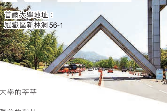
首爾大學正門回的大龍門，寓意學生鯉躍龍門。