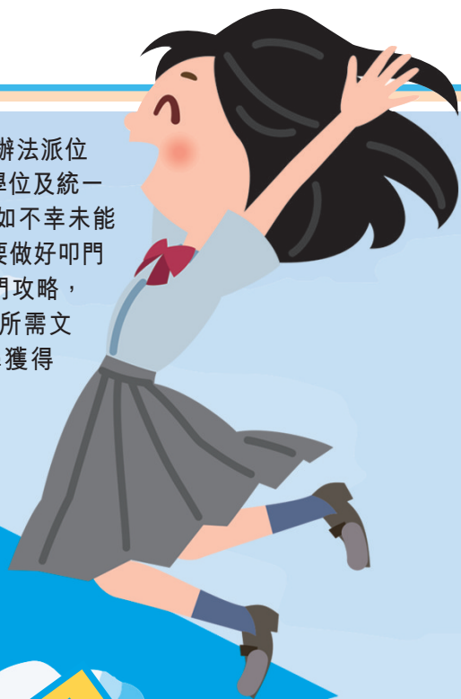
■ 數名學生參與升中派位叩門面試。

2024年度中學學位分配辦法派位(中一派位)，包括自行分配學位及統一派位的結果將於今日公布，如不幸未能獲心儀學校取錄的學生，就要做好叩門準備。本報特此整理升中叩門攻略，包括叩門次序、面試準備、所需文件等，希望能幫助同學獲得心儀學校學席。