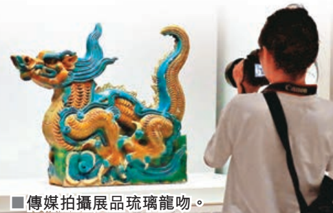
■傳媒拍攝展品琉璃龍吻。

展覽分為三個單元，設有多媒體裝置和陶藝工作坊，讓入場人士了解分布各地的窯口；更通過展示青花瓷的製作步驟，讓公眾設計屬於自己、獨一無二的陶瓷作品。館方亦會舉辦講座，由策展人和其他陶瓷專家介紹明代御用瓷器的發展歷史和對全球的影響，除了讓觀眾了解瓷器上圖案配置原則與花紋寓意，也更進一步認識中國陶瓷特色及影響。