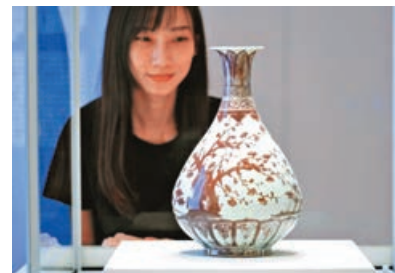
■釉裏紅松竹梅圖玉壺春瓶是國家一級文物。

香港故宮文化博物館開幕兩周年之際，與北京故宮博物院聯合主辦第十個全新專題展覽「流光影色——故宮博物院藏明代陶瓷珍品」，展出新一批借展的 106 件明代陶瓷珍品，當中包括 21 件國家一級文物，絕大部分為首次在港展出，包括「釉裏紅松竹梅圖玉壺春瓶」、「青花礬紅彩海水龍紋盤」及「鬥彩三秋杯」等，並聯同香港故宮文化博物館 7 件藏品，展現明代陶瓷工藝的發展演變和傑出成就。該個全新專題展覽今日起在展覽廳 3 開放予公眾參觀，為期兩年。負責是次展覽的策展團隊表示，這一批珍藏可以呈現明代早、中、晚期陶瓷工藝的發展演變，被形容是中國陶瓷藝術登峰造極之作。