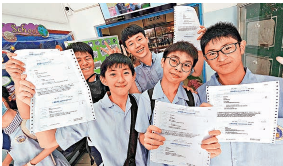
■升中派位昨日放榜。

全港逾5萬名小六學生期待已久的升中派位昨日公布結果，今年獲派首三志願滿意率為91%，與去年一樣。大批學生在家長陪同下早上冒着炎熱天氣回校領取派位結果，部分人表現興奮，甚至喜極而泣。有獲派首志願、順利入讀傳統名校的學生指，本身是Band 2水平，為了提升實力，周一至周五放學均會補習，狂谷下終於如願以償。有家長則指，兒子在小五起已積極參加課外活動、社會服務，以配合中學取錄學生的要求，而作為家長，壓力比兒子更大，放榜結果理想，算是鬆一口氣。