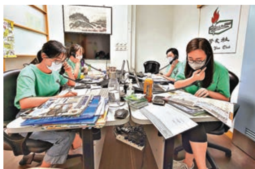
■有機構提供輔導熱線解答考生疑問。

青協「DSE 27771112」在5月至6月間訪問了513名中六考生及802名中五準考生，了解他們的升學規劃情況。在應屆DSE考生中，58.3%以大學學位為升學目標，有21.2%打算升讀碩士，僅不足一成(5.5%)人目標為副學士或高級文憑，為近五年最低，反映追求更高學歷的考生愈來愈多。