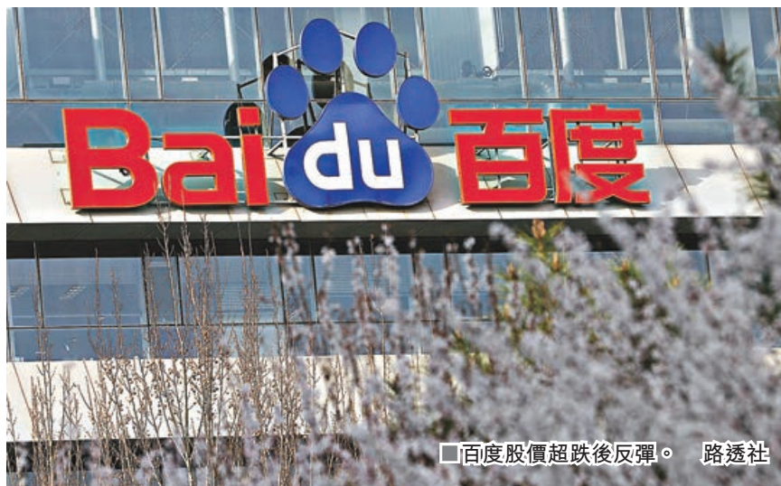
百度股價超跌後反彈。

港股昨衝高後回壓，日內跌幅不算太大，但總體未能擺脫反覆下放運行模式，要注意短期後市有進一步下探傾向。恒指跌51點，以跌低於17,500點收盤，是4月25日以來首次。大市成交金額升至逾1,000億元，但低於年內日均成交金額1,097億元，盤面流動性未見轉活。