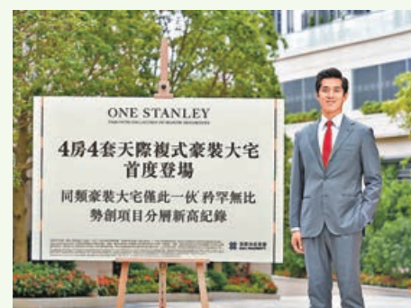
■ ONE STANLEY 累售 11 伙，吸金逾 9.56 億元。