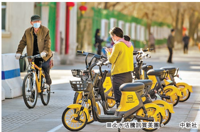
北水沽騰訊買美團。

港股昨天跟隨內地股市反彈，中證監叫停證金公司轉融券業務，市場相信措施有助增強A股穩定性，加上內地下周召開三中全會，市場憧憬政策面帶來利好消息，是刺激股市回升的因素。恒指漲360點，回企至17,800點水平收盤，大市成交金額在1,000億元左右，但仍低於年內日均成交金額1,096億元，顯示盤面流動性有待轉活。