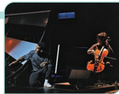
■ 弦樂結合電子音樂，帶來極大膽粗獷的音樂質感。