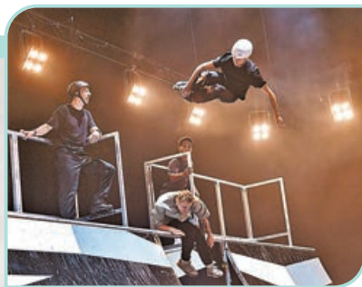
■《狂舞自由式》將極限運動與舞蹈音樂共冶一爐。