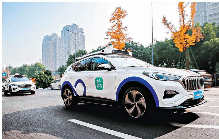
■ 百度旗下「蘿蔔快跑」訂單量迎來爆發式增長。

港股彈升兩日累升逾800點後，昨天再度下跌，惟未有影響剛恢復的階段性平衡狀態，但要注意盤面流動性明顯縮降，不利開展新一輪輪動，若情況未能改善，估計對後市維穩及推動力將構成影響。恒指跌近280點，以18,000點水平收盤，大市成交金額減至逾900億元，跌23.7%，也低於年內日均成交金額1,096億元的標準水平。