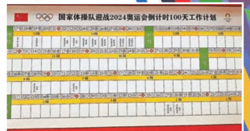
體操隊早定好備戰日程，態度認真。