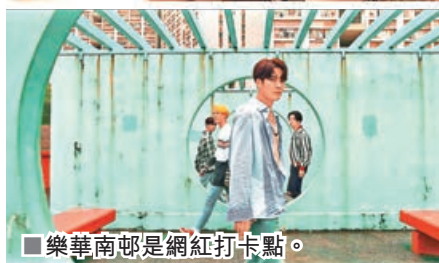
■樂華南邨是網紅打卡點。