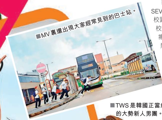
■MV 裏還出現大家經常見到的巴士站。

韓國娛樂公司 HYBE 旗下 PLEDIS 娛樂力推的新人男團 TWS，出道初就以大勢男團 SEVENTEEN 的師弟團身份備受關注，3 月時更首次來香港出席 KCON 會各位港迷。走校園青春風格的 TWS，這次的 MV 故事以 6 位少年放學後的故事展開序幕，成員們穿着校服在將軍澳一所中學取景，大家熟悉的班房、走廊、黑板等都有入鏡。TWS 還在觀塘偉業街行人天橋上演「日劇跑」情節，這條天橋因為電影《志明與春嬌》成為打卡熱點，作為男女主角首次相遇的地點，又被稱為「志明橋」。天橋的設計獨特，遠看就像火車車廂，橋身的長方形窗口就如相片方框一樣，更是少有的藍色及粉紅色系天橋，十分適合影出日系小清新風格的靚相。