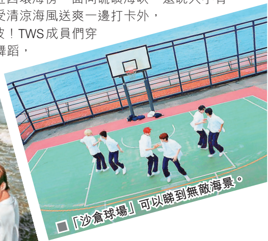
■「沙倉球場」可以睇到無敵海景。