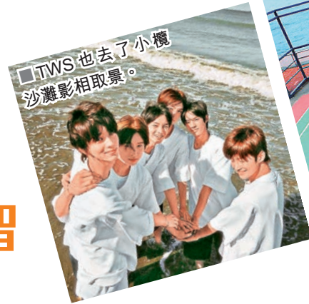
■TWS 也去了小欖沙灘影相取景。

被不少人認為是全港最靚球場的堅尼地城臨時遊樂場也是這次 MV 的取景地。遊樂場位於堅尼地城的西寧街，又被稱為「沙倉球場」，由堅尼地城地鐵站步行大概 11 分鐘就可到達，內設有一個籃球場和兩個能容納 7 人的足球場。特別之處是靠近西環海傍，面向硫磺海峽，遠眺大小青洲，除了可以一邊享受清涼海風送爽一邊打卡外，還可以對住無敵海景打波！TWS 成員們穿上校服在籃球場大跳新歌舞蹈，大騷青春活力。