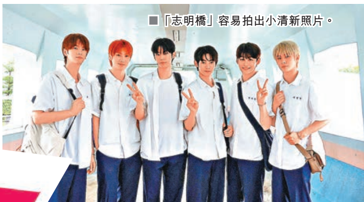
■「志明橋」容易拍出小清新照片。