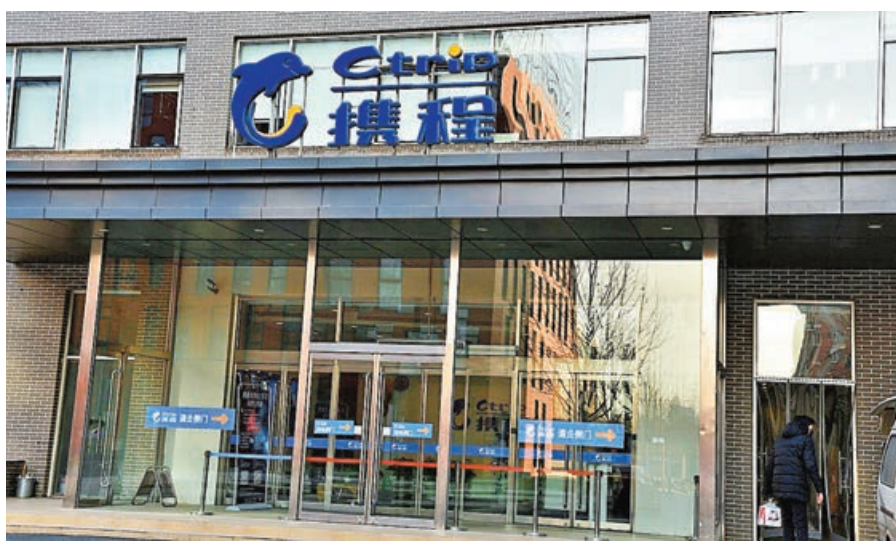
旅遊相關股跌勢加劇。