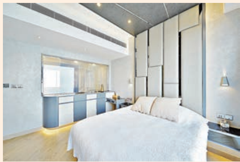
■ 純白設計的主人房，包括背景特色牆、大床、玻璃窗框和白色冷氣槽。