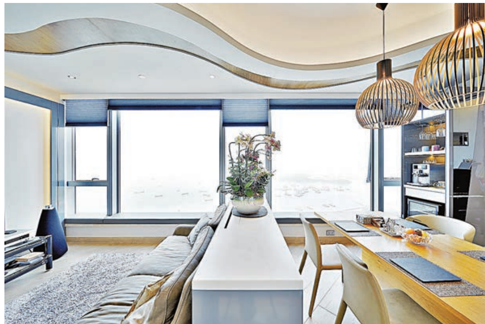
■ 客廳透過中島收納櫃分隔開。