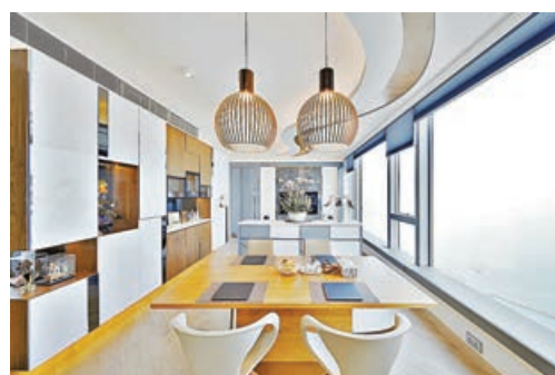
■ 全屋以白、灰及木色為框架，襯以幾何圖形，打造極具空間感的時尚之家。