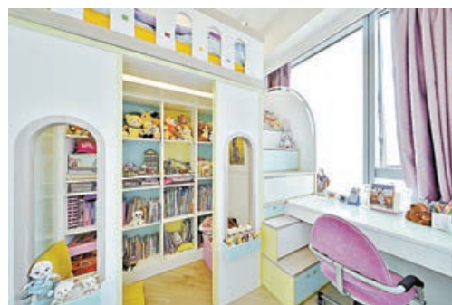
■ 兒童睡房上層為睡床，下層則為收納書櫃。