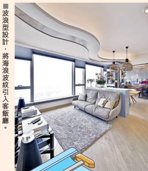
■ 波浪型設計，將海浪波紋引入客廳。