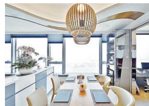
■ 飯桌配以鳥籠吊燈，甚具特色。