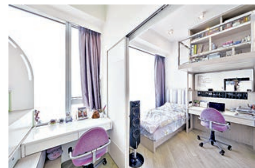
■ 多用途睡房，擺放兩張書桌。

置配合波浪造型的雙層天花燈槽，瑰麗海景隨之而迎入室內，氣勢磅礴。客飯兩廳設計以時尚為軸心，手上胡桃木、反光物料及幾何元素，為免有違和感，設計師特意將廳區所有門都改成暗門，襯以時尚大方的特色牆，不顯突兀之