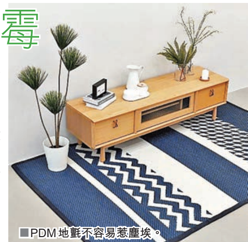
■ PDM 地氈不容易惹塵埃。

香港天氣時凍時熱，時濕時乾，除了讓大家無所適從，也讓家中地氈很難處理，今次要推介的是，來自泰國品牌抗菌防霉的 PDM 地氈系列！ PDM 地氈與一般的毛毛地氈比較，改用了環保纖維製作，不容易惹塵埃或積聚塵蟎，更抗菌。只需吸塵機吸去垃圾紙屑，用濕抹布輕輕一抹就可以了，非常容易清潔打理。如想全面清洗，還可以直接用清水潔淨，適合有小朋友和寵物家庭使用。