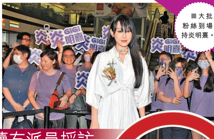
■ 大批粉絲到場支持炎明熹。