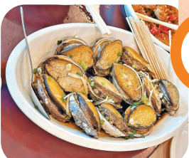
鮑魚爽口彈牙，十分新鮮。

因三面環山，出口狹窄，就像一個袋子而得名的布袋澳，是港人至愛的假日食海鮮勝地。島上只有兩家海鮮酒家，我們選擇在「海鮮島」用餐，一個半手掌大的開邊龍蝦、需要自己扭開的新鮮彈牙鮑魚、鮮甜濃郁的魚湯及清蒸石斑等8個菜，旅行社表示8人人均只需250元，實在非常抵食！