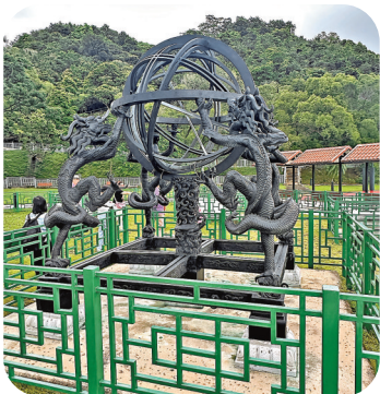
天文公園內的渾天儀。

最後一站來到萬宜水庫的西壩，這裏是備受推崇的五星級行山風景線，還有一座全港唯一的天文公園。公園內展示了8件中國古代的天文儀器，比如日晷、渾天儀等，讓遊客可以了解祖國的天文發展史。到了夜晚，公園設置了可以靠背的觀星椅，還有5台可轉動的20x80雙筒天文望遠鏡，極大便利露營的天文愛好者。