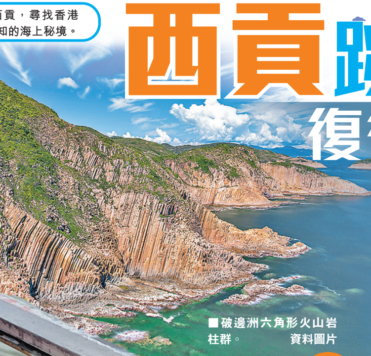
破邊洲六角形火山岩柱群。 資料圖片