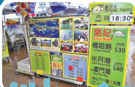
西貢碼頭有多家街渡公司可供選擇。