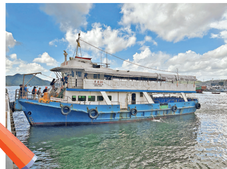
西貢多了不少街渡選擇，方便市民出海。