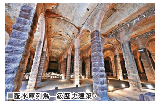
配水庫列為一級歷史建築。

新安排下，水務署會按先到先得方式予參觀人士入場，開放時間為週一至日上午9時至中午12時及下午2時至5時，每月首個周二為休館日，市民亦可繼續透過水務署「前深水埗配水庫導賞團網站專頁」預約參加導賞團。