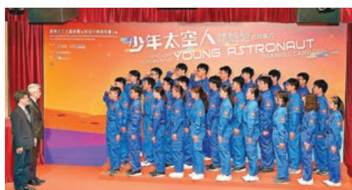
30名中學生經歷9日航天訓練。

康文署表示，這一屆體驗營的學員將首次到訪文昌航天發射場，他們亦會參觀文昌航天科普中心及文昌航天超算中心等；之後學員會轉到北京參觀國家天文台本部，並到航天員科研訓練中心體驗航天員訓練項目，包括穿脫航天服、野外生存訓練及品嚐太空食品等。學員最後會到訪發射載人航天任務的酒泉衛星發射中心及位於西安的中國科學院國家授時中心。