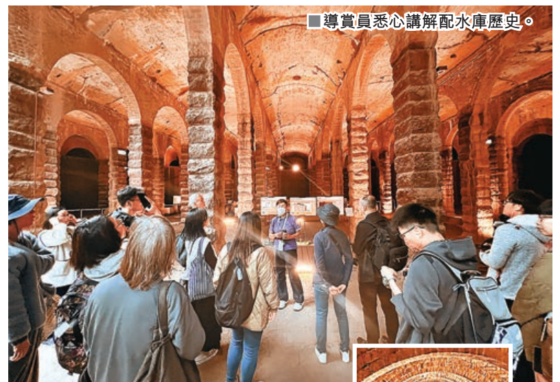
導賞員悉心講解配水庫歷史。

前深水埗主教山配水庫有過百年歷史，2021年被確認為一級歷史建築，其結合歐洲傳統風格花崗石柱與仿羅馬紅磚拱券建築在香港十分罕見，不少市民希望親臨「打卡」，每次推出參觀名額都即時爆滿。水務署日前宣布，由8月1日起市民毋須預約也可以進場參觀，不過必須查清開放日子和時間，否則隨時白行一趟，場地可容納人數上限為100人。