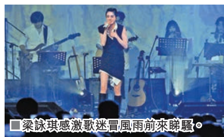
■梁詠琪感激歌迷冒風雨前來睇騷。

兩場音樂會。Gigi出發前曾一度擔心航班延誤，未能如期出發，幸天公作美，音樂會如期進行，Gigi十分感謝歌迷冒風雨前來睇騷。音樂會尾聲，Gigi投出「震撼彈」，宣布將於11月移師香港，帶給大家一個全新的廣東歌音樂會，Gigi希望可以近距離看清楚每一位現場觀眾的臉，更歡迎歌迷提供期望的歌單，一起選出演唱會的rundown，希望帶給大家一個快樂及滿意的演出。