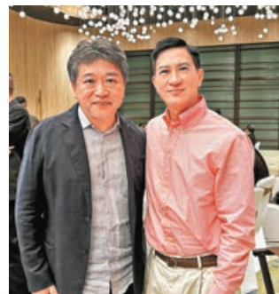
■家輝(右)與是枝裕和惺惺相惜。

張家輝應第7屆馬來西亞國際電影節邀請，其執導及主演電影《贖夢》成為電影節的閉幕電影，他更獲頒「卓越電影成就獎」。前日家輝現身吉隆坡舉行的頒獎禮接受榮譽，他指今次得獎及攜同新作參展別具意義，皆因大馬是他導演之路的起點，更喜遇日本大導演是枝裕和及香港影圈好友，大家都把握機會交流或叙舊。他說：「今次獎項對我又有一個更深層次嘅鼓勵，過往我擺過一啲演員嘅獎項，但今次頒發呢個卓越電影成就獎，包含大會對我做導演範疇上面嘅鼓勵，證實到我愛電影。」