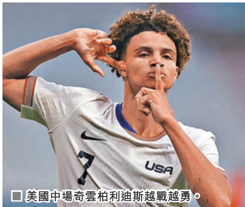
美國中場奇雲柏利迪斯越戰越勇。

摩洛哥首仗面對牌面更高的阿根廷爆冷成功，無論攻守表現都令人眼前一亮，但次戰對體力化防守的烏克蘭卻屢攻不下，末段在人多打人少優勢下竟被對手反擊偷雞而輸波，上輪大勝伊拉克只因對手技遜兩皮，而且防線鬆散