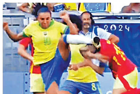
瑪達(左)出裂頭腳好離譜。