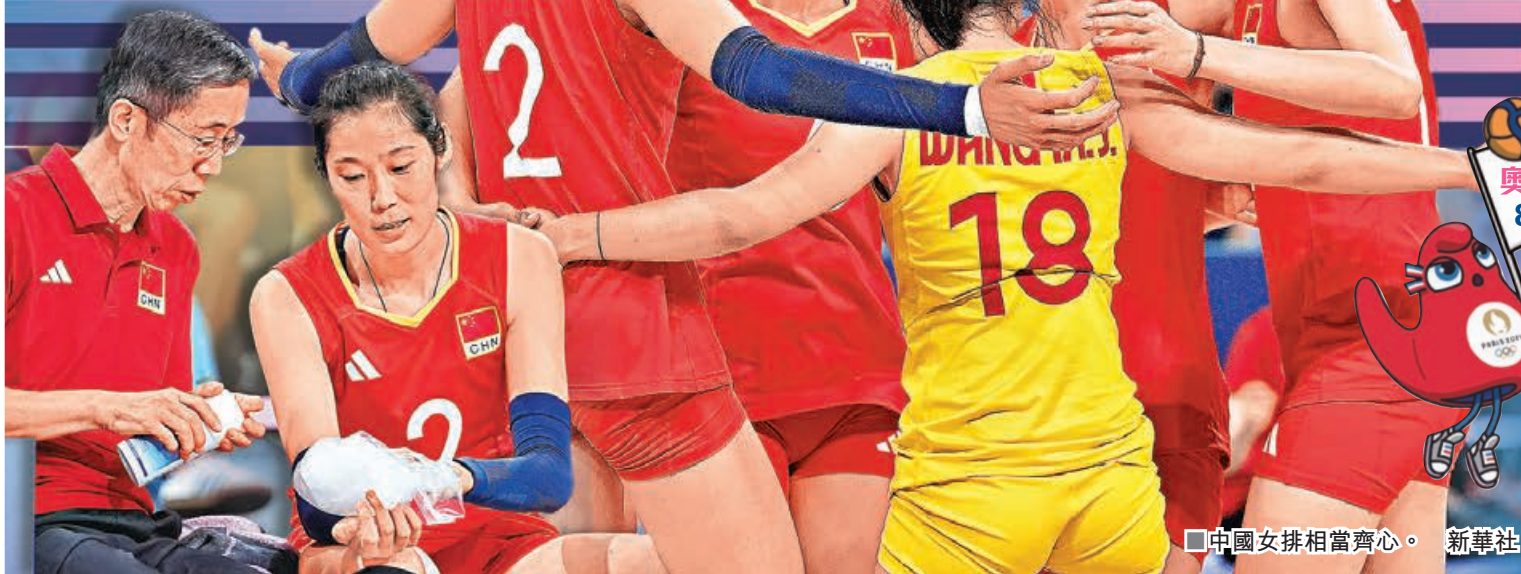
中國女排相當齊心。