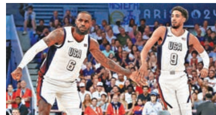
美國男籃勒邦占士(左)與新星夏利布頓擊掌鼓勵。

餘下一場八強戰為塞爾維亞對澳洲，由金塊MVP祖傑領軍的塞爾維亞，如能贏波便會遇上美國對巴西勝方，但澳洲亦非善男信女，會與塞國合演好戲。