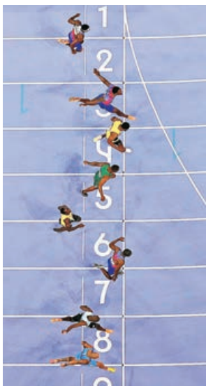
百米飛人賴利斯(下起第三人)壓線一刻。

27歲的賴利斯在場內場外經常自詡能力能媲美保特，事實上，這位美國飛人去年便成為了自2015年的保特後，首位在世界賽囊括100、200及4X100米跑的三金得主。今次也令他成為自2004年雅典奧運的基寧後，首位來自美國的奧運飛人。