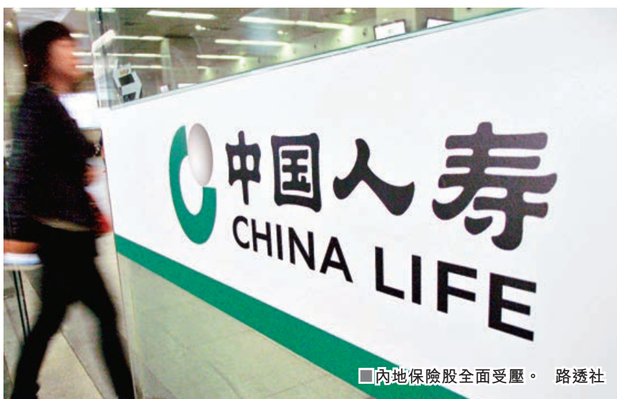
內地保險股全面受壓。

日圓強勢收斂下，近日困擾全球市場的套息交易拆倉活動似乎暫告一段落，估計外圍股市經歷了一波殺跌後，將可迎來短暫技術性反彈，相信港股也繼續自己運行節奏，伸延震盪下放行情。事實上，環球經濟增長放緩，相信是全球股市都要面對的挑戰。