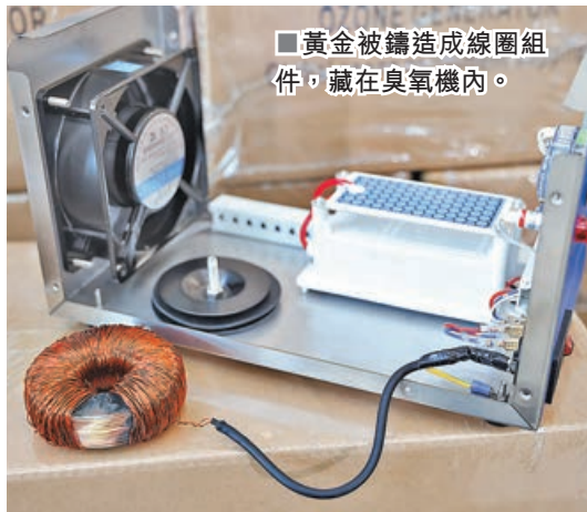
■黃金被鑄造成線圈組件，藏在臭氧機內。

行動中海關檢獲多部手機、電腦、公司銀行文件、銀行卡及虛擬貨幣錢包，凍結4名被捕人名下多個銀行戶口內共220萬元資產，相信行動已成功瓦解一個利用傳統銀行體系及虛擬貨幣交易的洗黑錢集團。海關將繼續調查海外可疑資金及虛擬貨幣去向，會利用分析工具追蹤虛擬貨幣流向，同時向虛擬貨幣交易平台獲取資料，有需要時會向海外執法機構尋求司法協助。