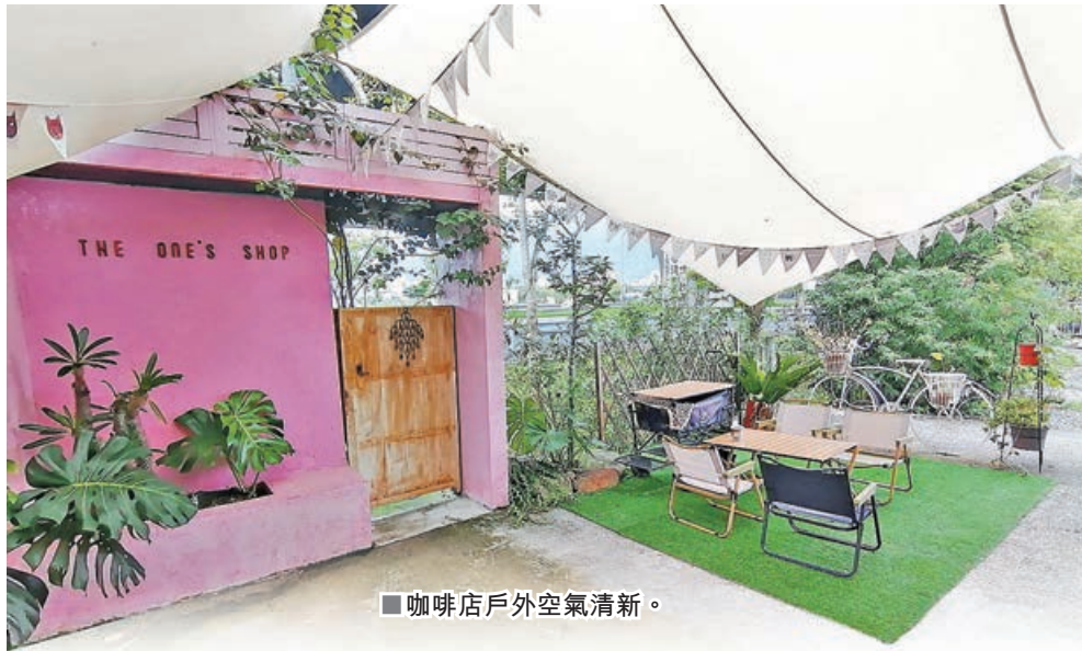
■咖啡店戶外空氣清新。

如果你正準備想來個小旅遊，帶着小朋友簡簡單單舒適遊，或許宜蘭是一個理想的旅點。在這裏，你能享受到寧靜的生活，林木茂盛，入目皆綠，自然景觀優美，生態環境豐富，是一個適合一家大細同遊的好地方。而且，這裏有不少專為一家大細玩樂而設的民宿，其中「小蘋果民宿」在谷歌上的評價高達4.6顆星，被評為性價比高，其配套設施齊備，周邊還有不少玩樂的旅點。另外，如大家喜歡貓貓，還可到萬記商行一趟，在這兒你可以邊吃邊玩貓貓，相信足以令你悠閒半天，放鬆心情，讓你與小朋友度過一個開心的假期。