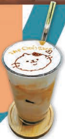
■飲品上有貓貓拉花，讓人捨不得喝下去。