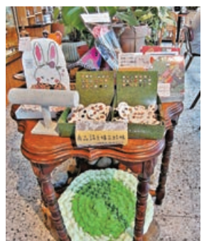
■店內除可品嚐美食，還可購買特色商品。