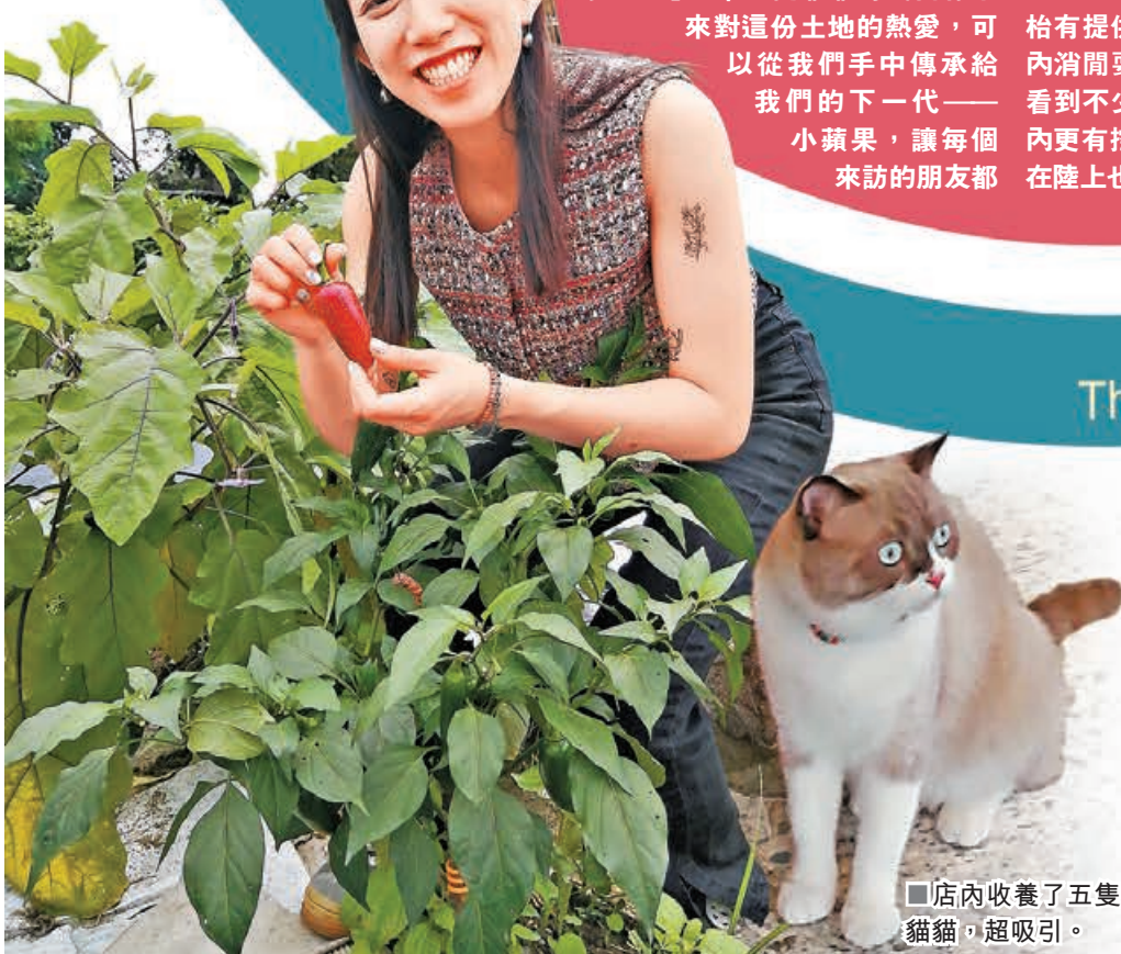
■店內收養了五隻貓貓，超吸引。