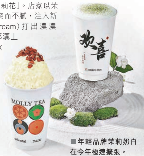
■年輕品牌茉莉奶白在今年極速擴張。

大家逛完愈欣書店，可到印里B2層的茉莉奶白一嘗雲頂奶白系列的「一朵茉莉花」。店家以茉莉雲頂做茶底，清爽而不膩，注入新西蘭安佳奶油(Cream)打出濃濃Creamy奶蓋，頂部灑上合桃碎，香脆軟綿，加上奶蓋中融入花茶香氣，感受多種層次，推出後極速熱賣，店員推薦7分糖及少冰口感最佳。另外，其他如奶白系列的茉莉奶白、粉茉針王亦是必點之選。