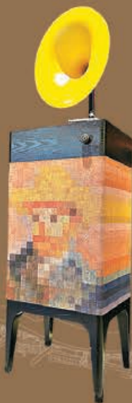
■黃色留聲機的馬賽克圖案，充滿藝術氛圍。