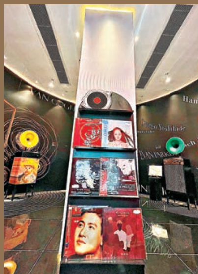
■展覽售賣張學友的《吻別》復刻版黑膠碟(左下)，僅售¥299。