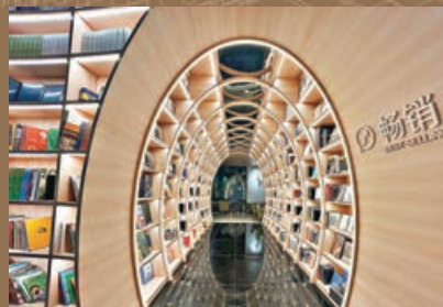
■穿越光影隧道，感受歲月靜好。